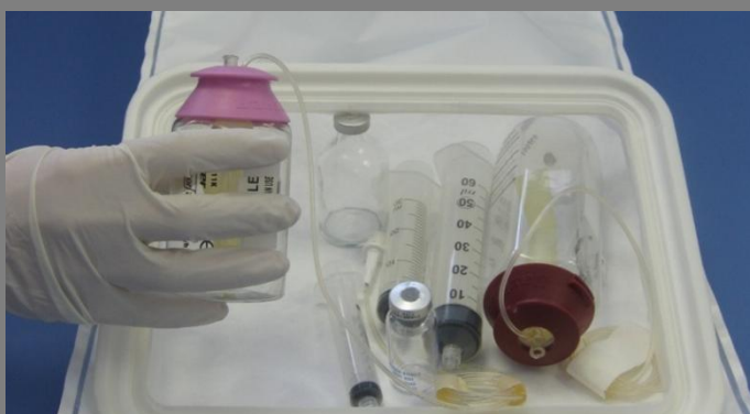
Exemple de conteneur STERIFLEX® Stérilisation par vapeur, ETO ou irradiation gamma. Tous les matériaux utilisés sont certifiés USP class VI.

Conteneurs flexibles pour la stérilisation et le transfert de composants via la porte STERIPASS® 290.